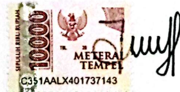
Jihan Helfi Syifanajiah

Deli Serdang, 5 Oktober 2024 Saya yang menyatakan,