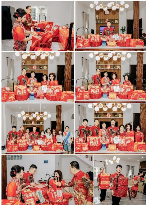
Gambar 3 Persiapan Sangjit