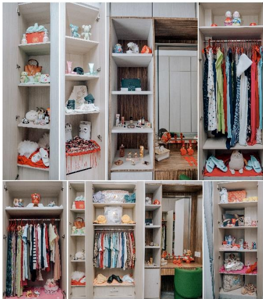
Gambar 2 Paitu