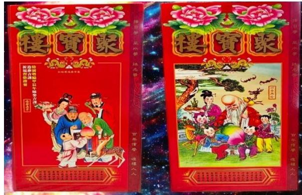
Gambar 18 Buku Thongsu