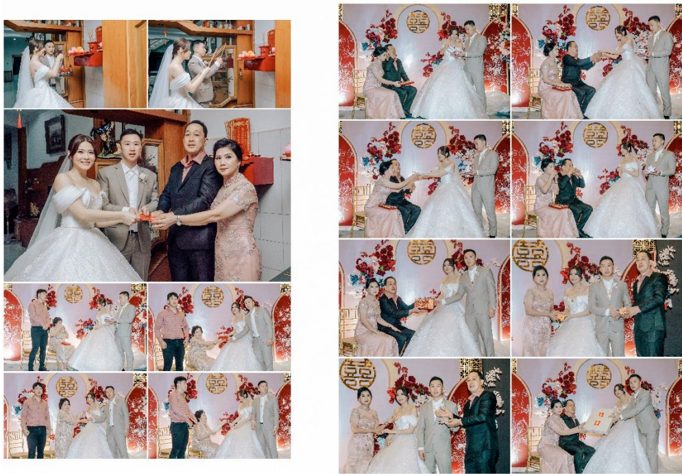
Gambar 6 Tea Ceremony