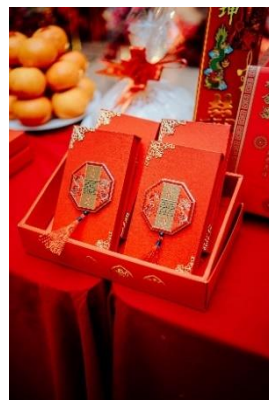
Gambar 15 Angpao