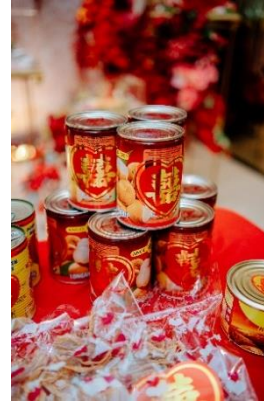
Gambar 11 Longan