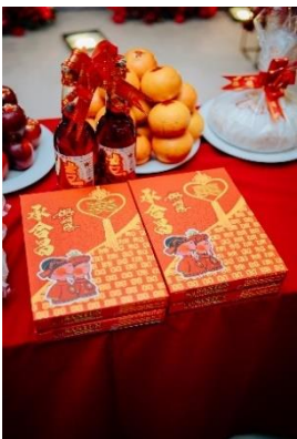
Gambar 13 Ta Pia