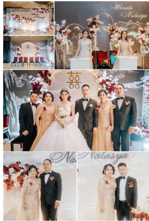
Gambar 8 Resepsi