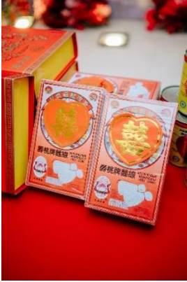
Gambar 9 Miesoa