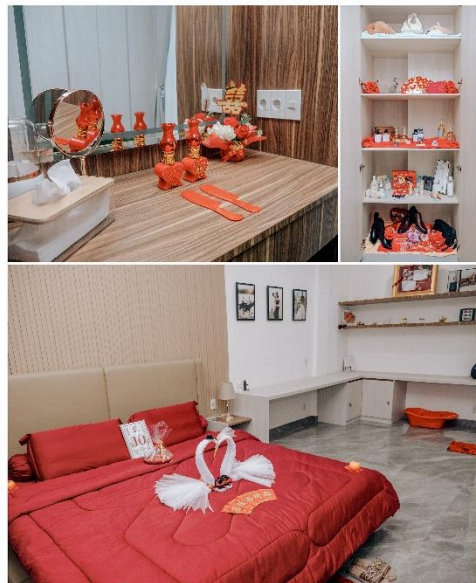
Gambar 4 Acheng