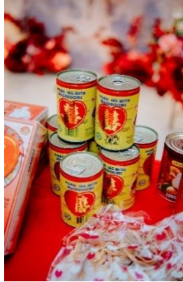
Gambar 10 Daging Kaleng (Tu Kha Kong)