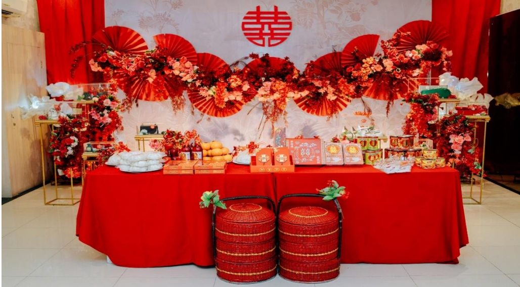
Gambar 17 Dekorasi Sangjit