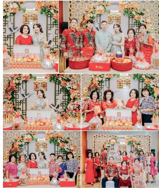
Gambar 5 Pelaksanaan Sangjit