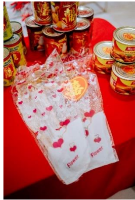
Gambar 14 Pyramid Gula