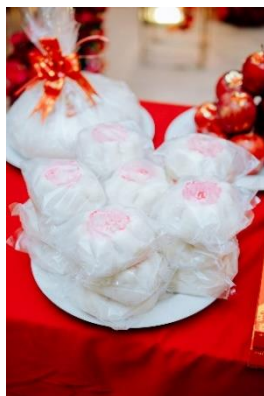
Gambar 16 Pao