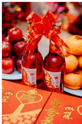
Gambar 12 Sirup Merah