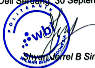
Shyria Herrel B Simanjuntak