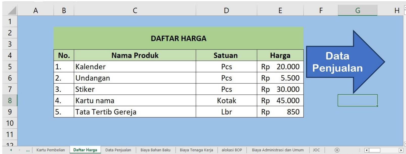
Lampiran 2 Daftar Harga