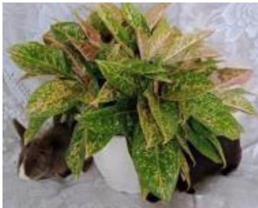
Gambar 2.1 Tanaman Hias Aglaonema

bersinar terang." Tanaman ini diyakini berasal dari wilayah Asia Tenggara atau Asia Selatan. Di habitat alaminya, aglaonema sering ditemukan di hutan dataran rendah dan di lereng gunung pada ketinggian sedang.