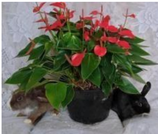
Gambar 2.2 Tanaman Hias Anthurium