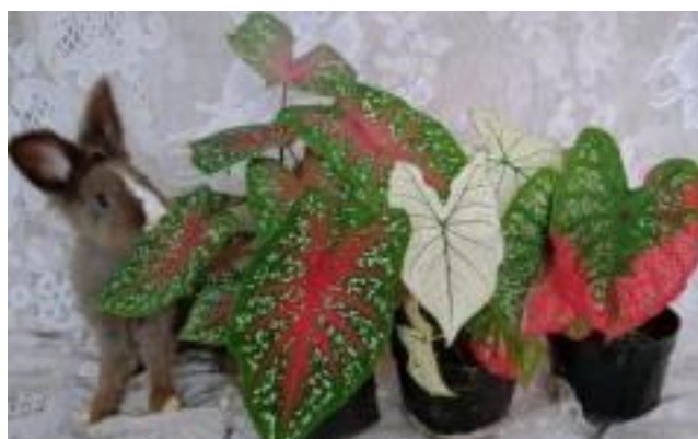
Gambar 2.3 Tanaman Hias Caladium

Caladium tumbuh secara alami di hutan tropis yang lebat, subur, dan berkelembapan tinggi. Habitat alaminya terutama berada di sepanjang sungai, di bawah kanopi pepohonan yang besar, dan di tempat lembap yang terlindungi, terutama pada ketinggian antara 0 dan 1000 meter atas permukaan laut.