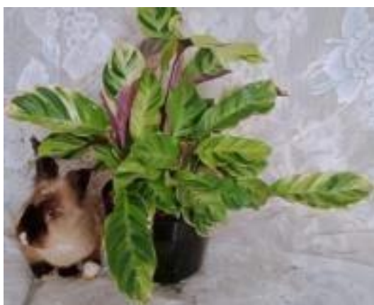
Gambar 2.4 Tanaman Hias Calathea

Calathea adalah jenis tanaman hias yang memiliki daun indah dan termasuk dalam keluarga Marantaceae. Secara tampilan, tanaman calathea memiliki kemiripan dengan aglaonema, namun perbedaannya terletak pada karakteristik batangnya. Batang tanaman calathea cenderung lebih kokoh dan memiliki daun yang dihiasi dengan pola belang-belang. Tanaman calathea termasuk dalam jenis tanaman tropis yang tumbuh baik di lingkungan yang lembab dan memiliki iklim yang hangat.