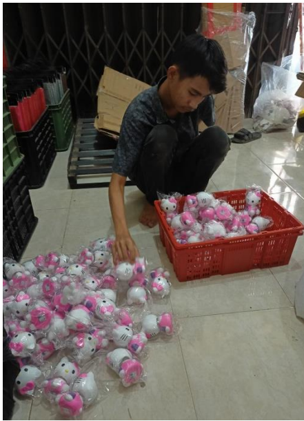
Produk Hewan goyang