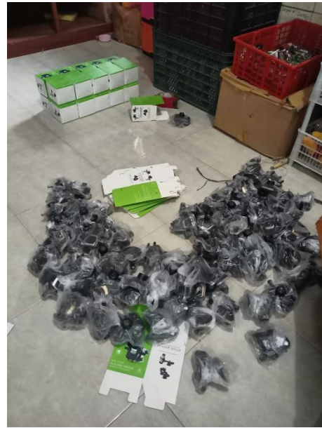
Produk Holder 09