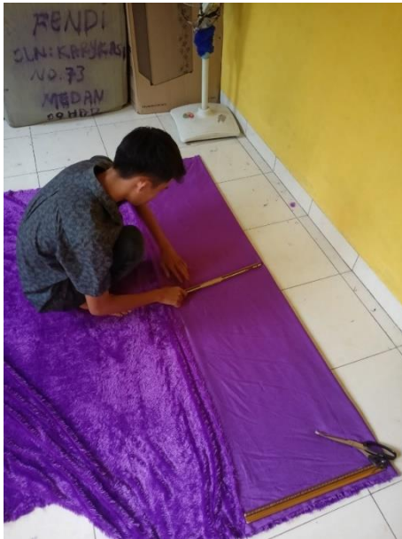
Pemotongan Kain Bulu Lokal