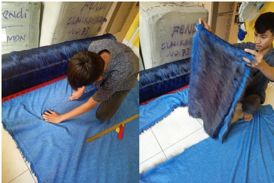
Proses Pemotongan Kain Bulu Impor