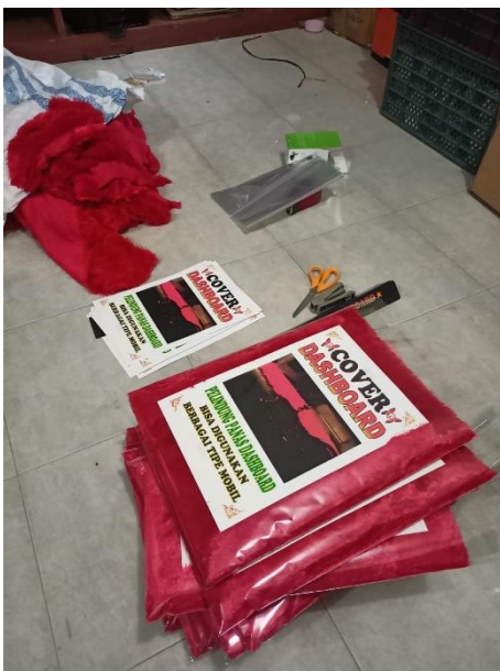
Packaging Dashboard Lokal