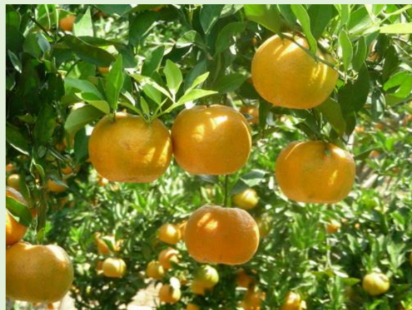
Gambar 4. Jeruk Keprok Batu 55

Jeruk dengan jenis Keprok Batu 55 merupakan jenis jeruk asli yang berasal dari daerah Batu. Jeruk jenis ini memiliki ciri kulit buah yang lebih tipis apabila dibandingkan dengan jeruk baby jova dan valensia, sehingga untuk mengupasnya tidak perlu menggunakan pisau dan dapat dikupas langsung dengan menggunakan tangan. Jeruk keprok batu 55 memiliki rasa yang manis. Apabila jeruk ini sudah masak fisiologi akan ditandai dengan warna kulit jeruk yang kuning-oranye dan memiliki rasa yang asam ketika belum masak. Jeruk keprok batu 55 ini juga merupakan salah satu jenis jeruk yang banyak ditanam di PT. Kusuma Agrowisata.