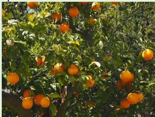
Gambar 2. Jeruk Baby Jova

Jeruk dengan jenis baby jova ini merupakan salah satu jenis jeruk peras yang memiliki rasa yang manis dengan kadar air yang tinggi. Jeruk Baby Jova ini memiliki ciri kulit buah yang tebal, dengan ketebalan mencapai 0,2 – 0,5 cm. Karena kulit buahnya yang tebal, untuk mengupas kulit buah jeruk baby jova ini perlu menggunakan pisau.