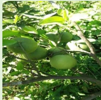
Gambar 3. Jeruk Valensia

pisau. Namun, jeruk jenis valensia ini memiliki rasa yang masam dan bentuknya lebih lonjong dibandingkan dengan jeruk jenis baby jova.