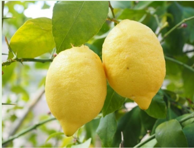
Gambar 6. Jeruk Lemon

Jeruk lemon belum terlalu banyak dikembangkan di PT. Kusuma Agrowisata ini karena kurangnya lahan. Jeruk lemon hanya dijadikan tanaman pinggiran saja pada batas-batas jalan dan disekitar lahan jeruk baby jova.