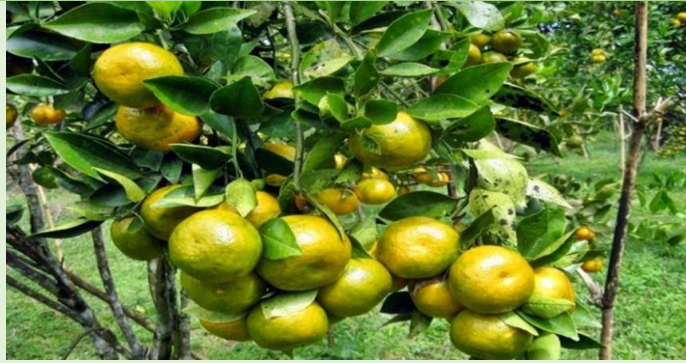
Gambar 5. Jeruk Keprok Siem