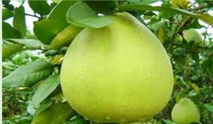
Gambar 7. Jeruk Pamelo