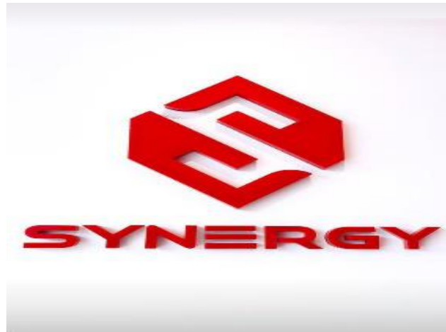
Gambar 3. Logo General Agency Synergy

Deli Serdang, 21 Maret 2020 seiring dengan pertumbuhan yang ada di berbagai wilayah di Indonesia, Panin Dai-ichi Life kian gesit untuk meningkatkan layanan dan memperkuat jaringan pemasarannya, termasuk di Deli Serdang, Sumatera Utara.