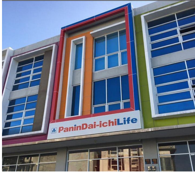
Gambar 2. Kantor General Agency Synergy