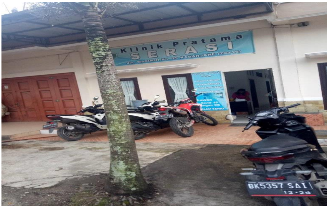
Gambar 7. 10 Tampilan depan Klinik