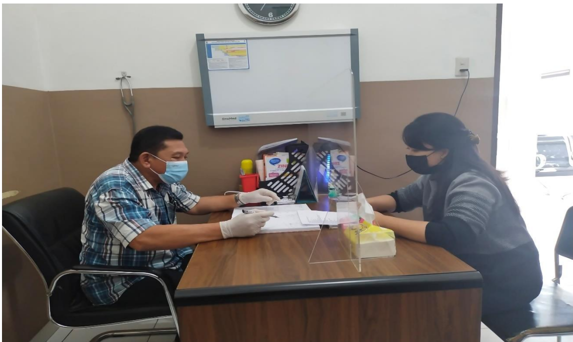
Gambar 7. 12 Foto Bersama Dokter Klinik Serasi