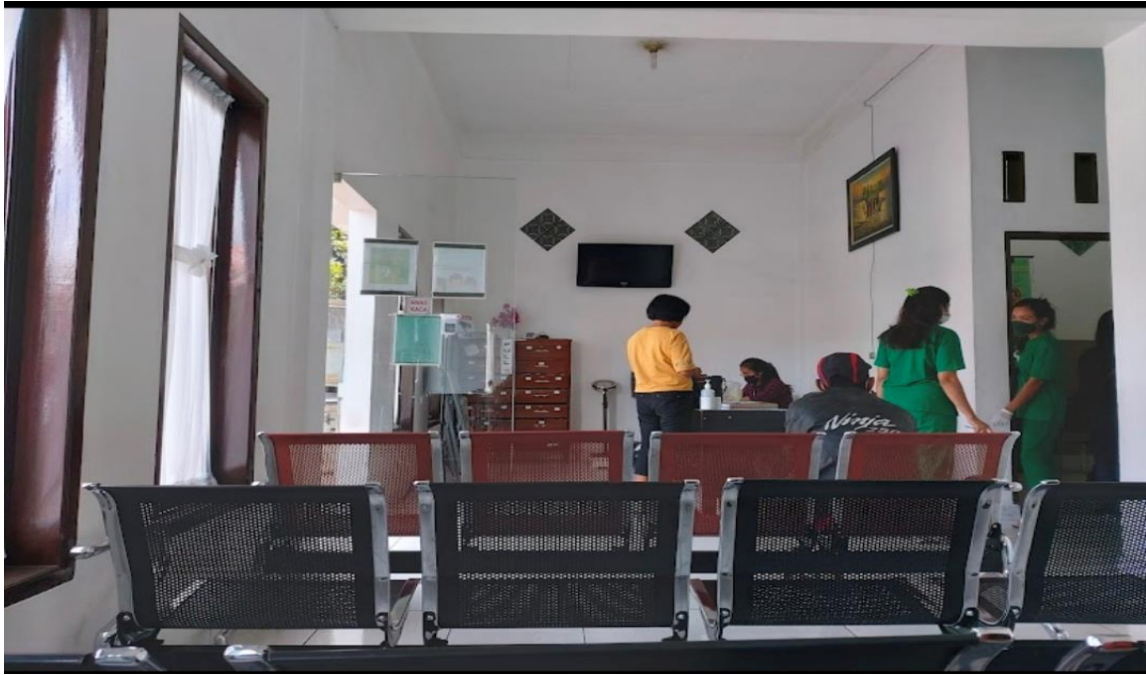
Gambar 7. 11 Ruang Administrasi Klinik